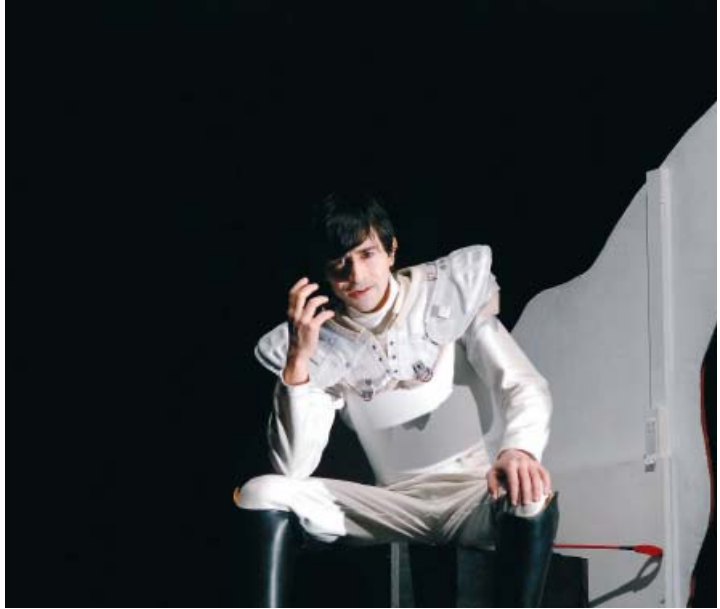
Immagine dallo spettacolo “La Caccia”