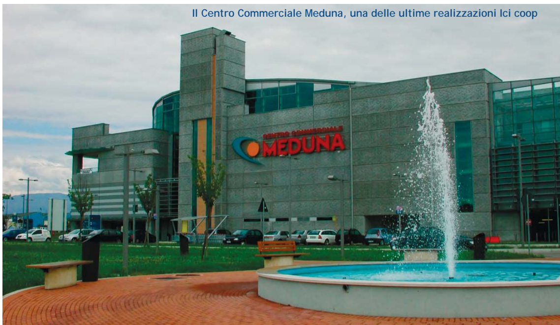
Il Centro Commerciale Meduna, una delle ultime realizzazioni Ici coop