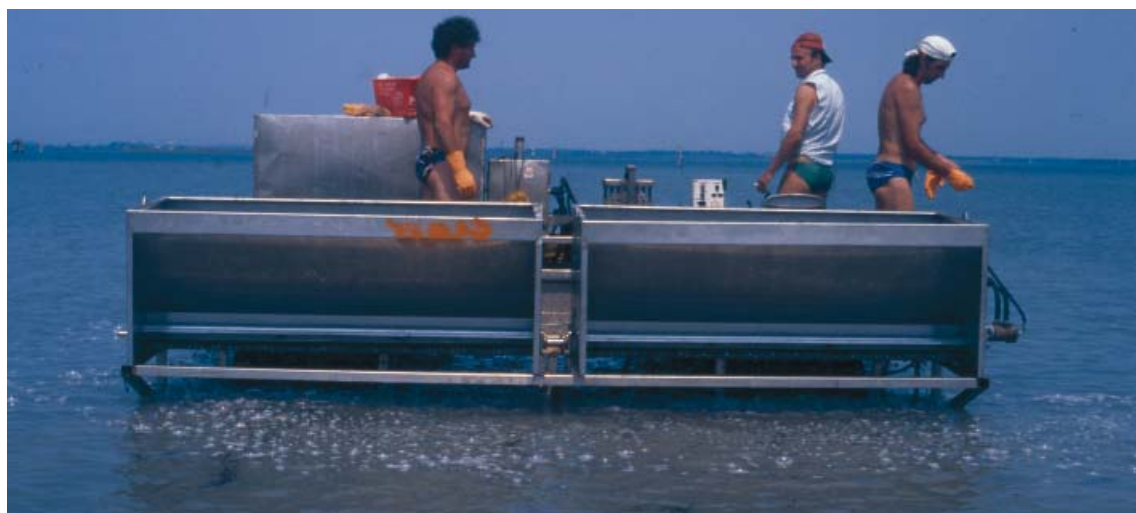
foto in basso: Laguna di Marano: semina di vongola verace per la coltivazione nelle aree in concessione

pag.17- dall’alto: interno Avannotteria Almar: reparto nursery per lo svezzamento del seme di molluschi bivalvi, reparto fitoplancton per la coltura delle microalghe alimento del seme di molluschi bivalvi, seme di vongola verace pronto per la semina nei parchi in concessione della Laguna di Marano